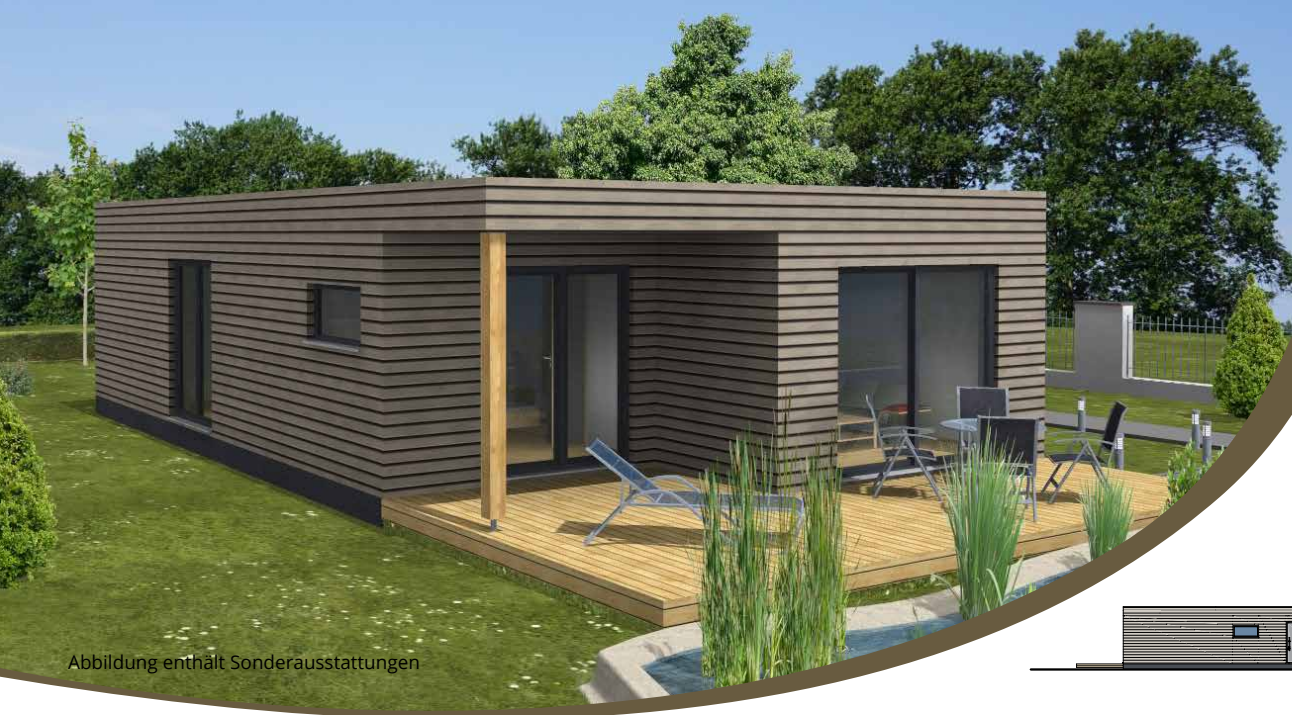
Abbildung enthält Sonderausstattungen